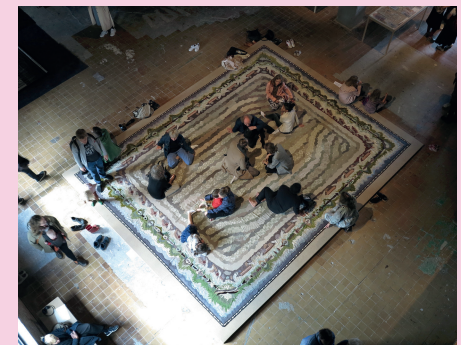
Transcript of a Fallow , 2019 appliqué, recycled textile, 470 x 600 cm. Transcript of A Fallow , tapestry, wool, linen, 1919–1920, by Elisabeth Tamm at Fogelstad who conceived the idea, by Maja and Amelie Fjaestad who weaved. (Installation view GIBCA 2019 and detail).

Born 1972 in Visby. Lives and works in Näshulta, Sörmland. Educated at NCAD Dublin, The Royal Institute of Art, Stockholm and Whitney ISP, NYC. Åsa is a.o. collaborating with Malin Arnell on Forest Calling – A Never-ending Contaminated Collaboration or Dancing is a Form of Forest Knowledge . Currently their work is presented in the exhibition 8 Degrees / Contemporary Art on the Forest at Bildmuseet, Umeå.