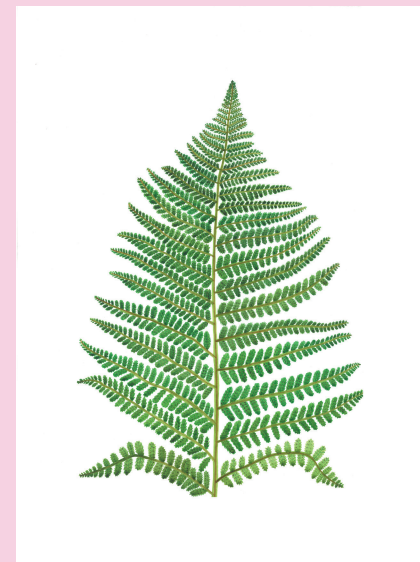
Bringing Down the Flowers (Male Fern), watercolour on paper, 2023

This series of watercolour paintings represent plants that were historically used by women to induce abortion. In style they are like the genteel flower paintings that were a popular hobby for women of the nineteenth century. The title Bringing Down the Flowers is a euphemistic expression – which apparently was used in the past to describe the process of inducing an abortion and bringing on menstruation. The paintings represent an unwritten 'catalogue' of hidden knowledge about female health, which would largely have been passed on orally between generations of women. I find the plants in various everyday urban places, including by the side of the road, in an underpass or at the local supermarket. Some will be familiar, but others can be poisonous if administered incorrectly.