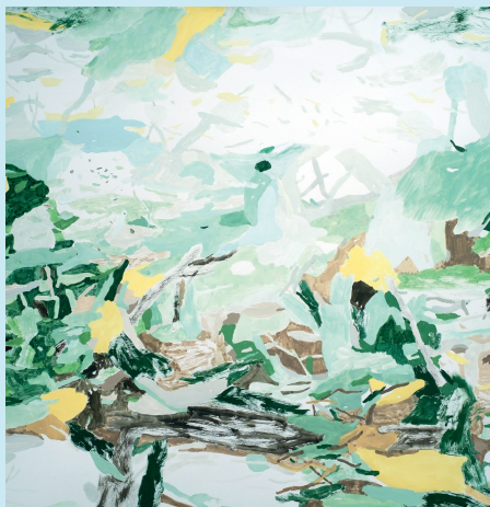
Hål i marken, 2024