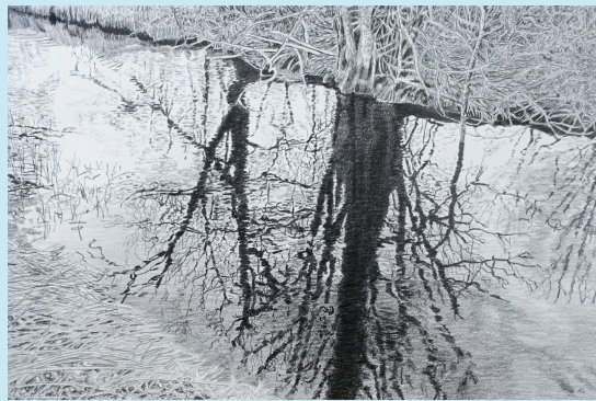
Tiden som passerar Blyerts på papper