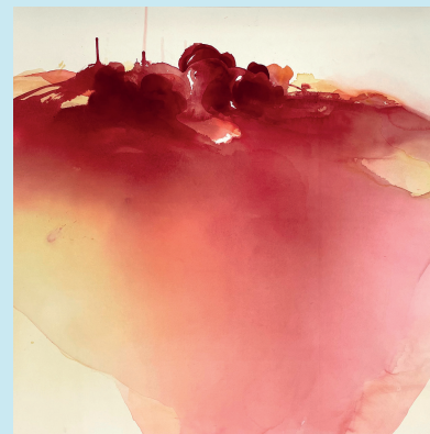
Röd längtan, akvarell, 2024

K: I naturen finns en kraft som är urstark, som visar sig i växtkraft och livsglädje. Men den är också så skör. Vi måste värna den och ha omsorg. Mina akvareller är abstrakta, där jag skildrar kraften i en uppåt-gående rörelse. En rörelse som strävar mot frihet och det livsnödvändiga ljuset, hoppet, men också vårt behov av skydd och omsorg i ett omhuldande skal. I botten finns svärtan, en tyngd som håller kvar, stödjer och vinglar litet på ostadiga ben.