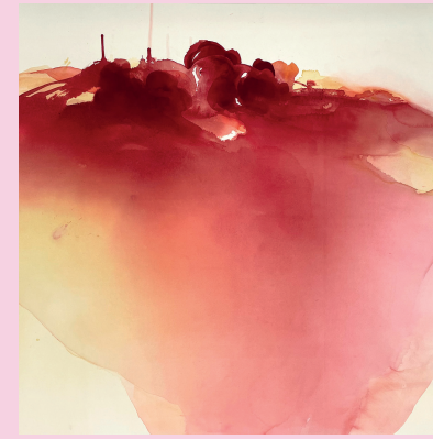
Red desire, watercolour, 2024

K: The nature's healing power is embodied in the joy of growth and the power of life. So strong but also fragile: something we must protect and take care of. My watercolours are abstract but describe a powerful rising movement. A quest for freedom, brightness and hope but also our need for a safe shelter. In the darkness there is a heaviness that weigh us down but also supports us on our wobbly small steps.