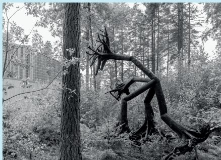
Spirit Tree Walking Offentligt konstverk för Mölbo IP, producerad av SymbioLab, 2022 Uppdrag av Telge Fastigheter och Södertälje konsthall

J: Jag flyttade nyligen till skogen och håller på att lära känna mina nya grannar; tall, gran, björk, mossor, lavar, blåbär, lingon, ljungräs och enbär. Vi har träffats förut, men nu är jag i relation med just dessa varelser varje dag. Min närvaro förändrar saker; där jag går, där jag kissar, förändrar deras tillväxt. Hur kan jag vara en allierad? Jag lämnar deras döda på marken för att skapa nytt liv, lyssna, ge medvetenhet och uppskattning. Detta är fröet till ((centrum för resonans)) en skogsstation för skulpturala, relationella, somatiska och ljudkonstpraktiker.