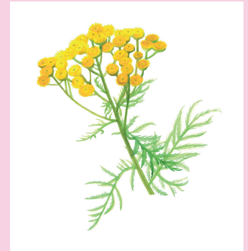
Bringing Down the Flowers (Tansy), watercolour on paper, 2023

Olivia Plender, born in London, 1977, based in Stockholm and London. Has exhibited internationally since the beginning of the 2000s and is represented in several public collections: Tate Gallery, UK, Arts Council England, Public Art Agency Sweden, Malmö Konstmuseum, Sweden. She co-curated the exhibition Chronos: health, access and intimacy at Tensta konsthall, Stockholm, which is open until 1 September 2024. In Sweden, she has had solo shows at Kalmar Konstmuseum in 2023, Marabouparken, Stockholm in 2007. She has also worked with text and has published texts, books and anthologies on subjects such as art, health, collectivism, grassroots movements and feminism. Has previously been shown at Södertälje konsthall in Portal, 2021.