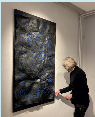
Blå prickar Storlek: h 147 cm, b 88 cm, d 8 cm. Material: Handformat papper av linne- lump, akrylfärg.

K: I en tid som vi kallar vår gläds vi åt naturens stora mångfald i form av blommande växter, fåglar, insekter mm. Vi minns fortfarande den hårt kramade buketten med tussilago som vi tog med hem och gav till mor. Eller blåsipporna på marken. Några av oss konstnärer ägnar idag mycket tid åt att åstadkomma blommande trädgårdar i närmiljön. Den lokala floran står oss alltid närmast. Oavsett om floran definieras som växter eller människors gemenskap eller konst.