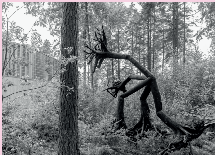
Spirit Tree Walking Public Art for Mölnbo IP, produced by SymbioLab, 2022 Commissioned by Telge Fastigheter and Södertälje konsthall

J: I moved to the forest recently and am getting to know my new neighbors; pine, spruce, birch, mosses, lichens, blueberry, lingonberry, heather, and juniper. I mean, we've met before, but it's different to be in relation with these beings every day. My presence is changing things; where I walk, where I pee, is altering their growth. How can I be an ally? Leaving their dead on the ground to support new life, listening, giving awareness and appreciation. This is the seed of ((center for resonance)) a forest station for sculptural, relational, somatic, and sound art practices.