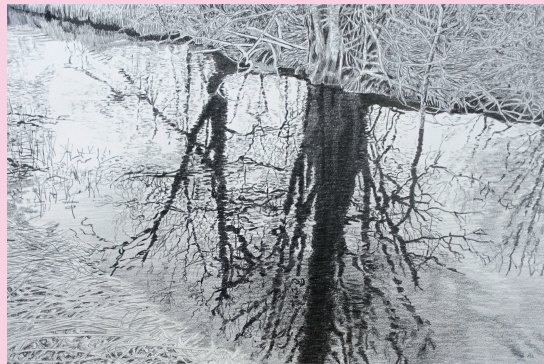
The time that passes, Pencil on paper