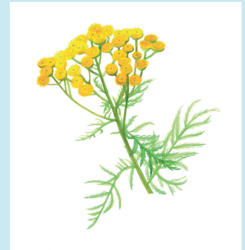
Bringing Down the Flowers (Renfana), akvarellfärg på papper, 2023

Olivia Plender, född i London, 1977. Baserad i Stockholm och London. Har ställt ut internationellt sedan början av 2000-talet och finns representerad i flera samlingar bl.a. Tate Gallery, UK, Arts Council England, Statens konstråd, Malmö Konstmuseum. Hon har co-curerat utställningen Chronos: health, access and intimacy på Tensta konsthall, som visas till 1 september 2024. Hon har gjort separatutställningar i Sverige på Kalmar Konstmuseum 2023 och Marabouparken i Stockholm 2007. Hon har också arbetat med text och har publicerat texter, böcker och antologier inom ämnen som konst, hälsa, kollektivism, gräsrotrörelser och feminism. Har tidigare visats på Södertälje konsthall i Portal, 2021.