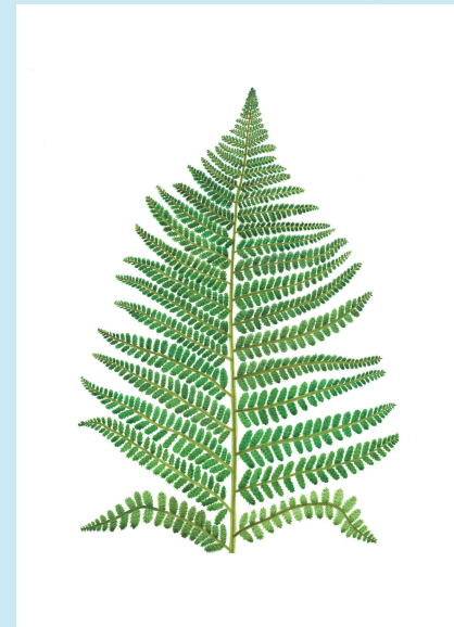
Bringing Down the Flowers (Träjon), akvarellfärg på papper, 2023

Akvarellerna representerar växter som historiskt använts av kvinnor för att framkalla abort. Stilmässigt ser de ut som de blomstermålningar som var en populär hobby för kvinnor på 1800-talet. Titeln Bringing Down the Flowers är ett eufemistiskt uttryck – som använts tidigare för att beskriva processen att framkalla en abort och få menstruation. Målningarna representerar en oskriven ”katalog” av dold kunskap kring kvinnlig hälsa, som till stor del skulle ha förts vidare muntligt mellan generationer av kvinnor. Växterna är plockade eller hittade på helt vanliga platser i en stadsmiljö, bredvid vägen, vid gångtunneln eller på den lokala stormarknaden. Vissa växter är lätta att känna igen, medan andra kan vara giftiga om de hanteras felaktigt.