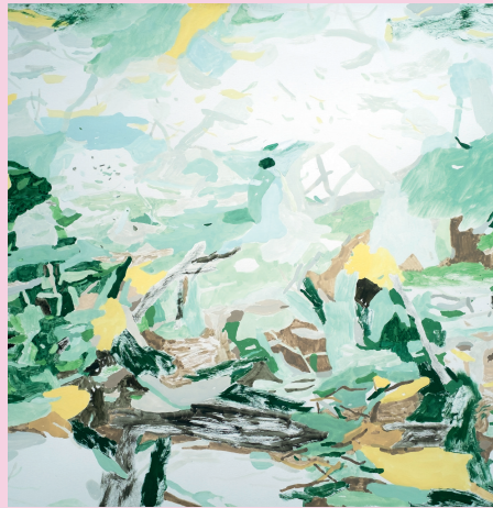
Hole in the Ground, 2023

Born 1981, Västerås. Lives and works in Järna. Educated at the Academy of Fine Arts in Umeå 2006-2011. The Swedish Arts Grants Committee's working grant 2022. Selected exhibitions: Vänersborg Konsthall, Örebro University Art Gallery, Nässjö Konsthall, Sacchska Children's Hospital, Galleri Andersson/Sandström, Norrköping City Museum. Public Art assignments: Uppsala City Library, Uppsala Municipality, 2020, Mesanseglet, Mimer AB, Västerås, 2016, University Park, Campus Valla, Linköping, 2011.