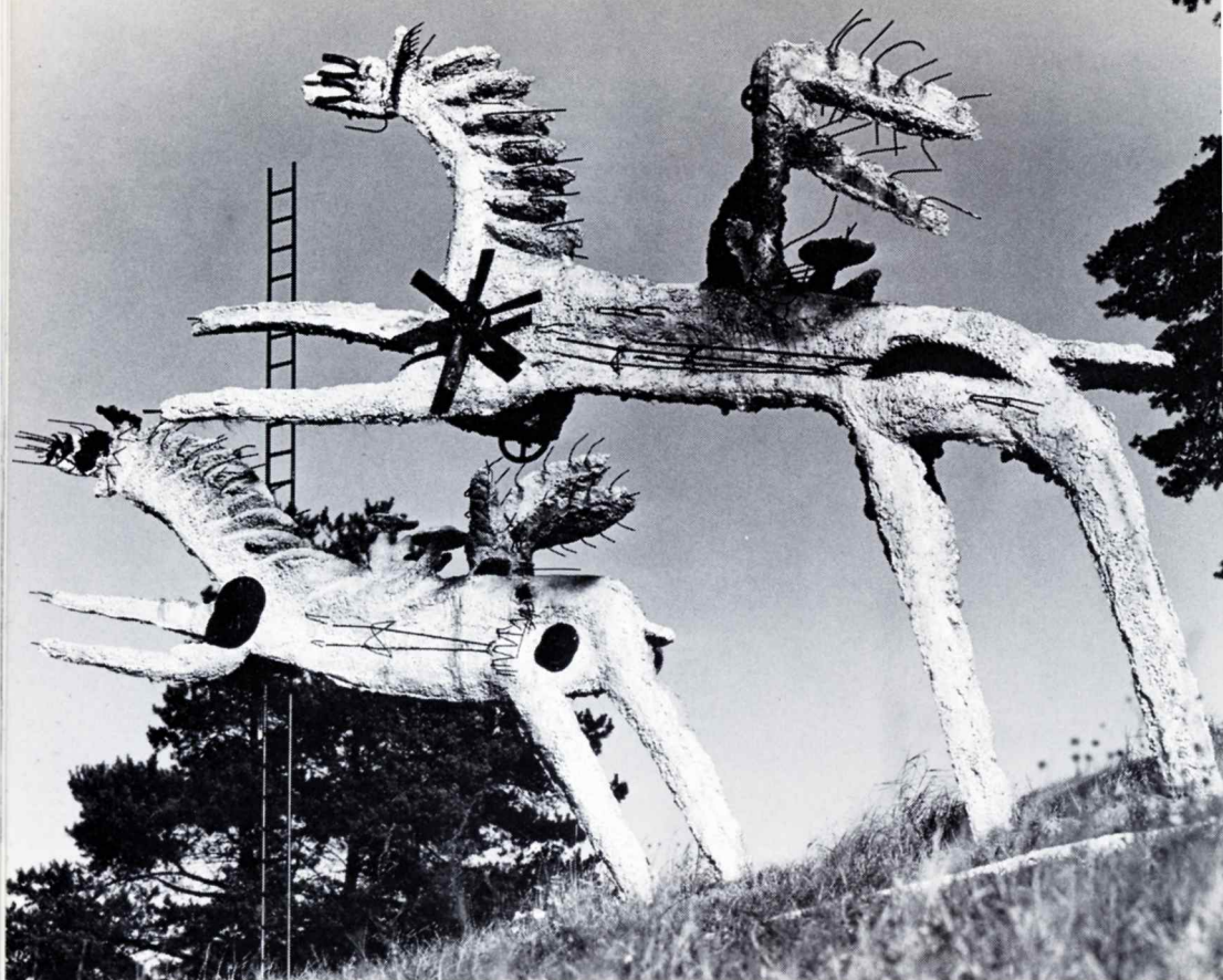
Skulpturgruppen "Solspann" Södertälje 1972-1976