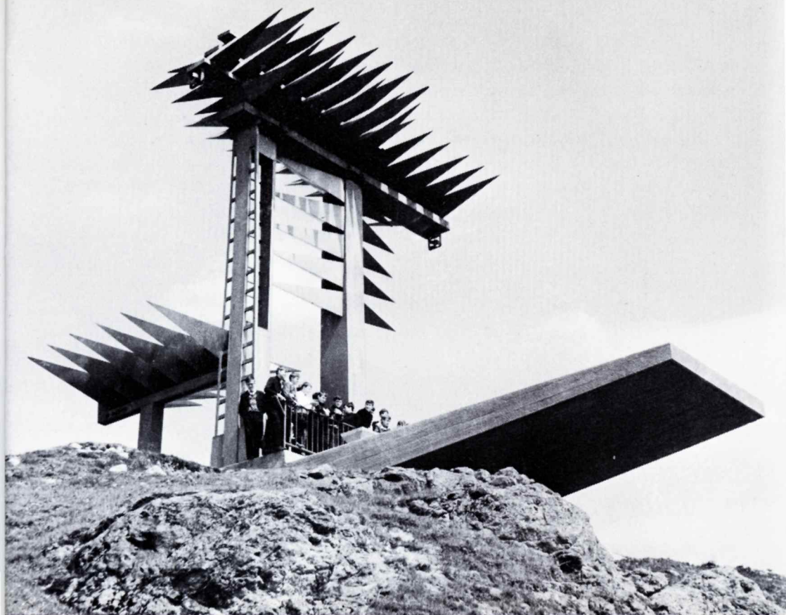
"Spelande orgel" monument över dem som stupade i kampen för det folkdemokratiska Polen, Czorsztyn, 1966