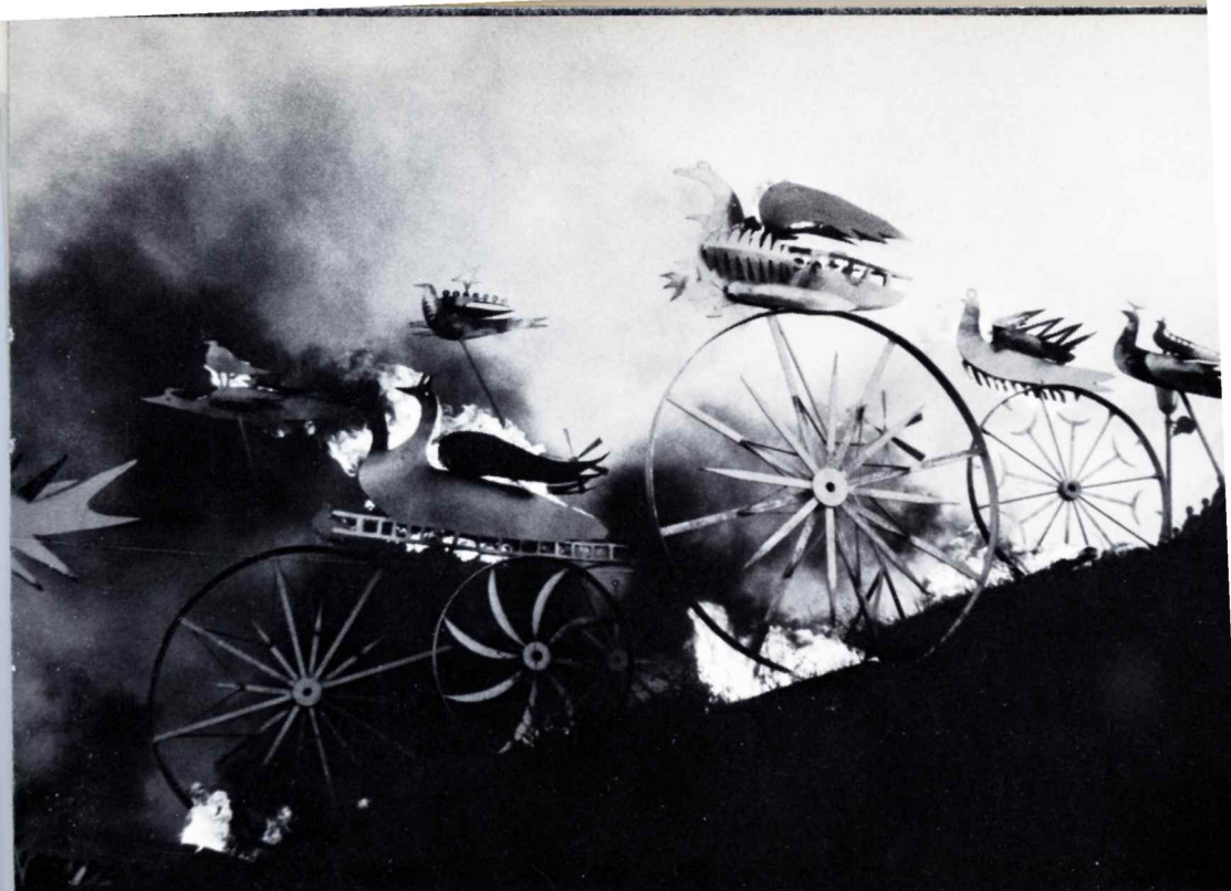
Skulpturgrupp "Eldfåglarna" Szczecin 1975

Paulo; "Profiler IV Polsk konst i dag", Bochum, Kassel; "Drömmen i polsk konst" (arr A Banach), Stedelijk museum, Amsterdam.