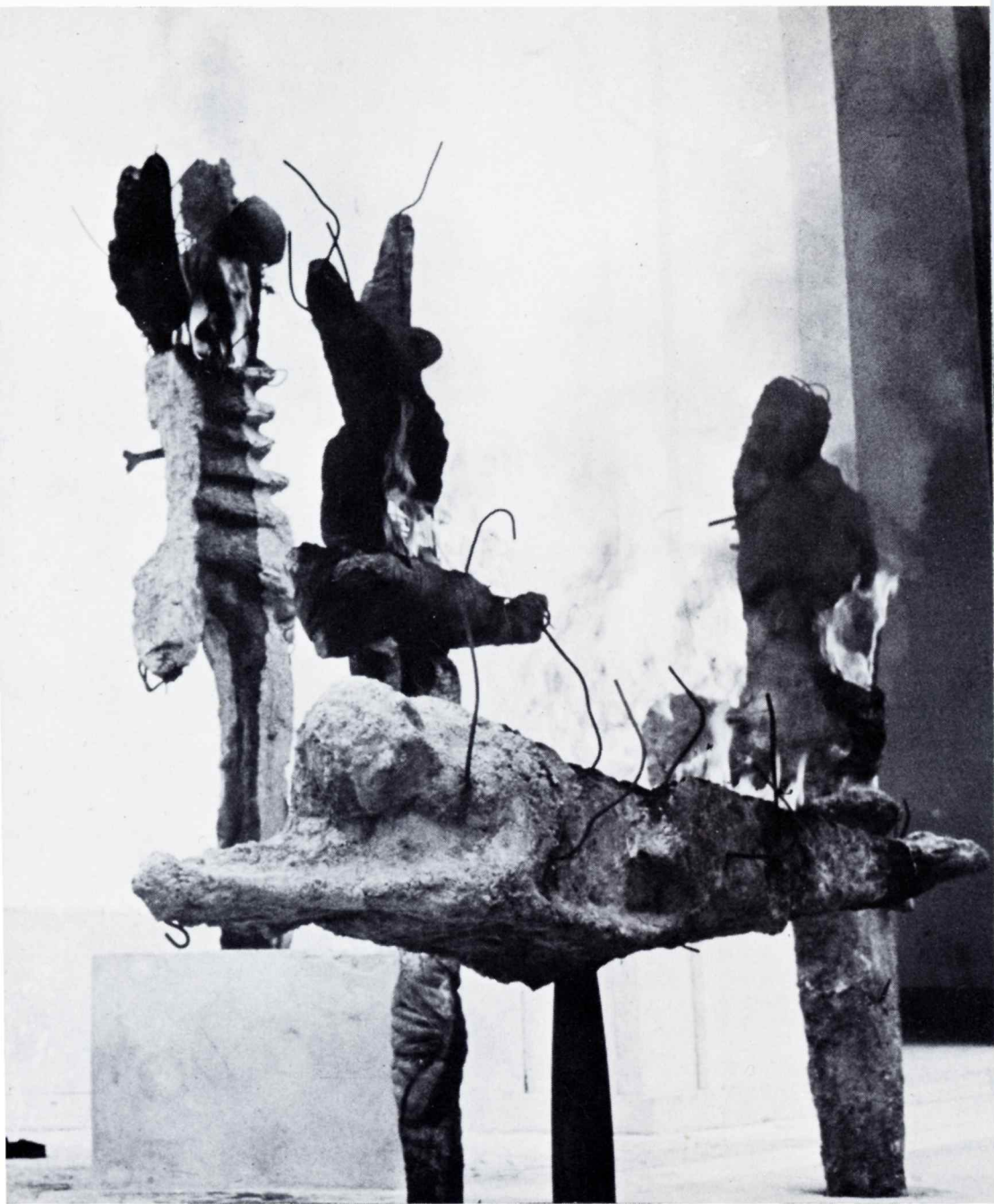
Utkast till monument "Till minne av de avrättade i Nowy Sącz" 1966-1968